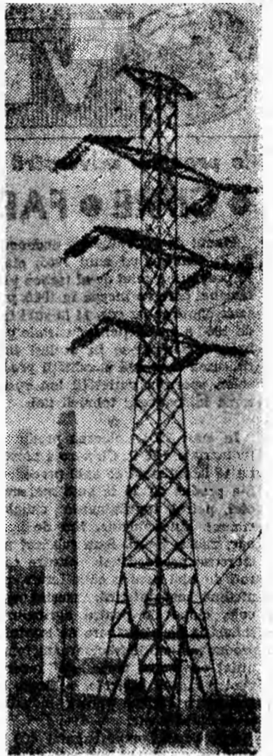
Ambianțe energetice I

Biroul Comitetului orgnenesc de partid Petroșani își exprimă convingerea că membrii de partid, omenii muncii din Valea Jiului vor desfășura o activitate neobosită în perioada care urmează pentru a-și aduce o contribuție sporită la îndeplinirea programului mareț de înflorire a patriei socialiste, de ridicare a bunăstării poporului, elaborat de cel de-al IX-lea Congres al Partidului Comunist Român.