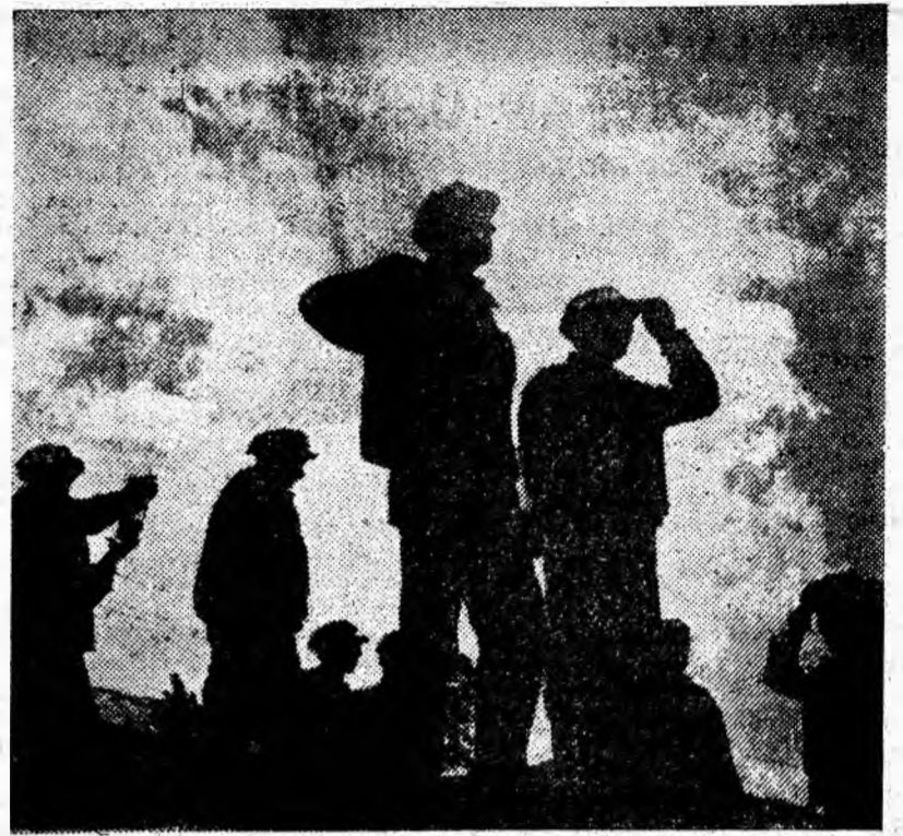
SILUETE MINIERESTI. În zori schimbul 1 merge la lucru.