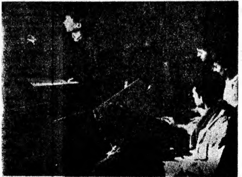
În sala de pictură a clubului sindicatelor din Lupeni.