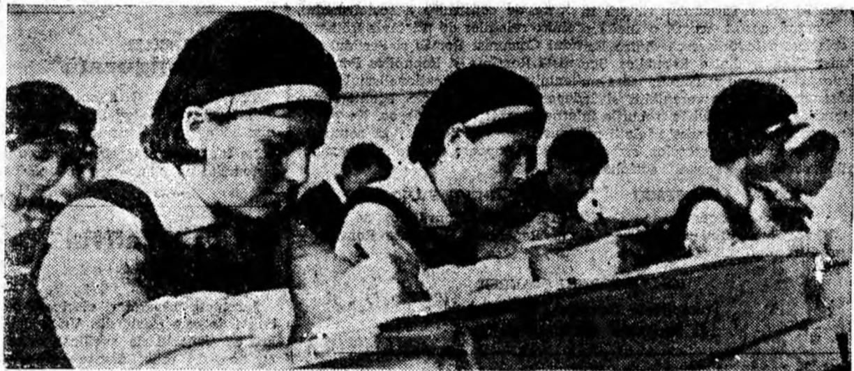
Oră de matematică la clasa a IX-a a Liceului din Vulcan.