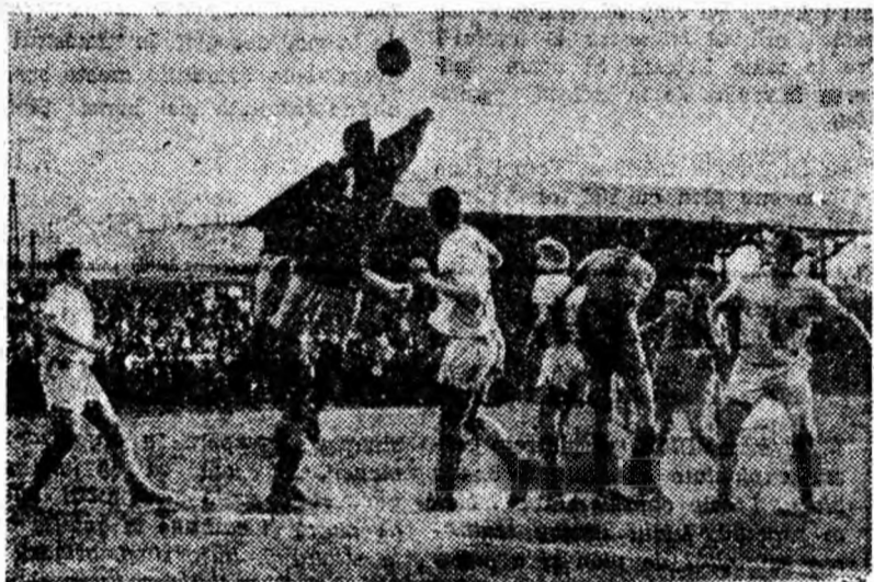
Portarul bătărean Bay respinge un nou atac la poarta sa.