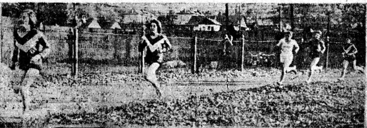
În pauza meciului de fotbal de la Lupeni a fost organizat un concurs de atletism între elevii de la școlile din localitate. Iată un aspect din timpul desfășurării concursului.