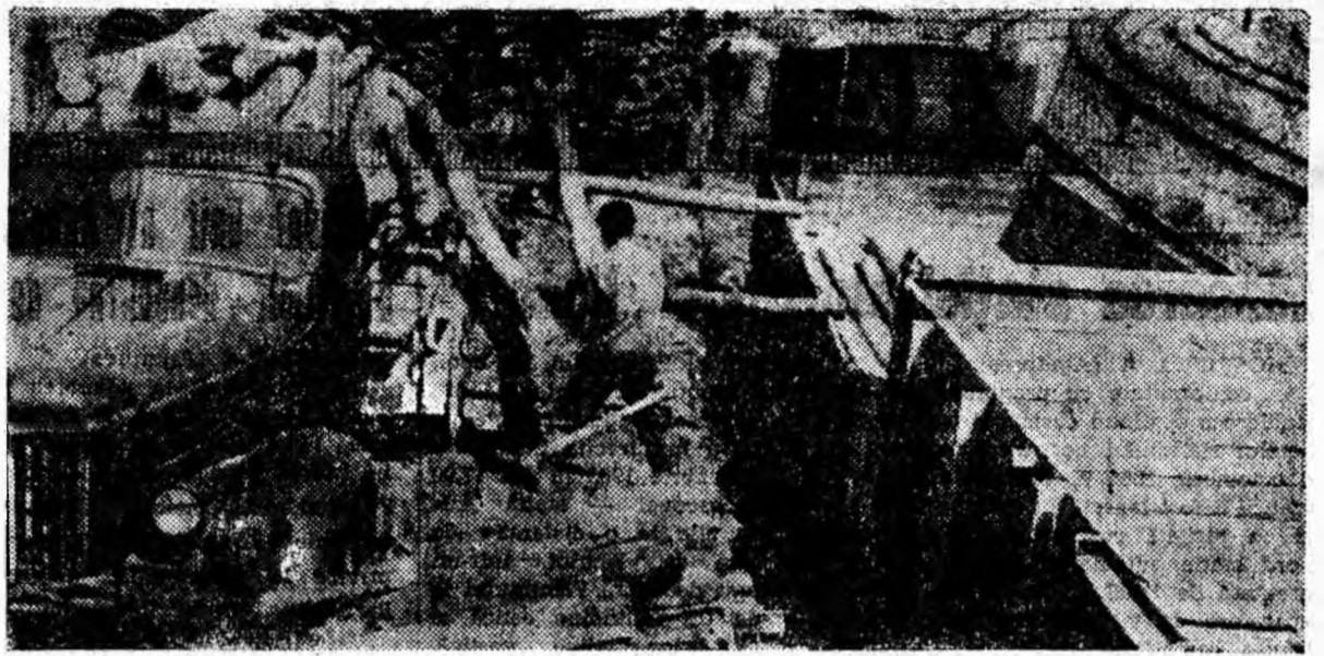
În gara Bănița, totesistiții încearcă convoaie de vagoane cu lemn.