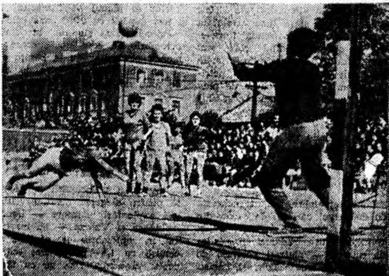
Gazdele ratează o nouă lovitură de la 7 metri.

Oaspetele, cu o echipă modestă, au avut în permanență inițiativa. Mai hotărâte în atac, ele au terminat prima repriză la o diferență de trei goluri (7—4). În repriza secundă constanțencele au scăzut ritmul de joc, permițând gazdelor să înscrie punct după punct și să egaleze în ultimul minut de joc. În această parte a întâlnirii handbalistele de la Constanța n-au marcat decât trei goluri.