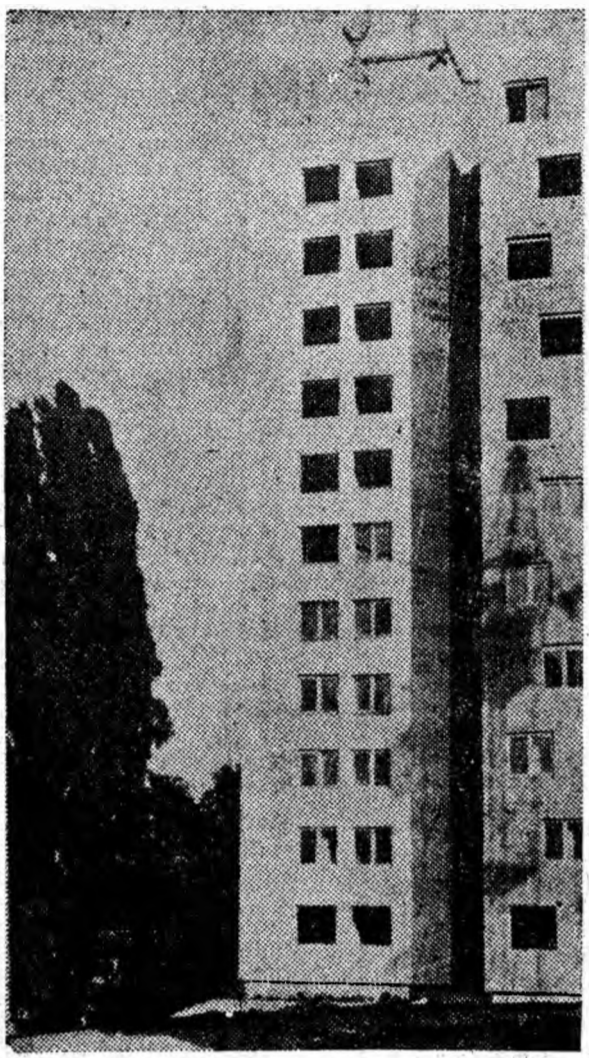
Blocul D 1 de la Lupeni, cu 66 de apartamente, își va primi în curînd locatarii.