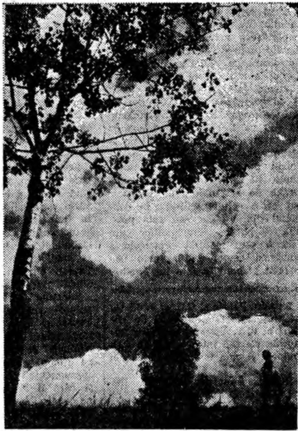
Mesteceniil își scutură frunzele

Revista mai cuprinde și rubrica „Scrisori către