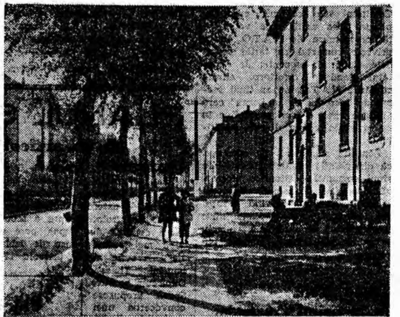
Toamna, pe străzile Uricaniului.

Duminică, 10 octombrie, ora 18, la cinematograful „7 Noiembrie” din Petroșani se organizează un concurs „Cine știe și răspunde” pe tema: „Momente din istoria filmului românesc”. Concursul este dotat cu premii. În continuare, spectatorii vor avea posibilitatea să vizioneze la acest cinematograful filmul românesc „Măara cu noroc” după rețeaua cu același nume de Ion Slavici.