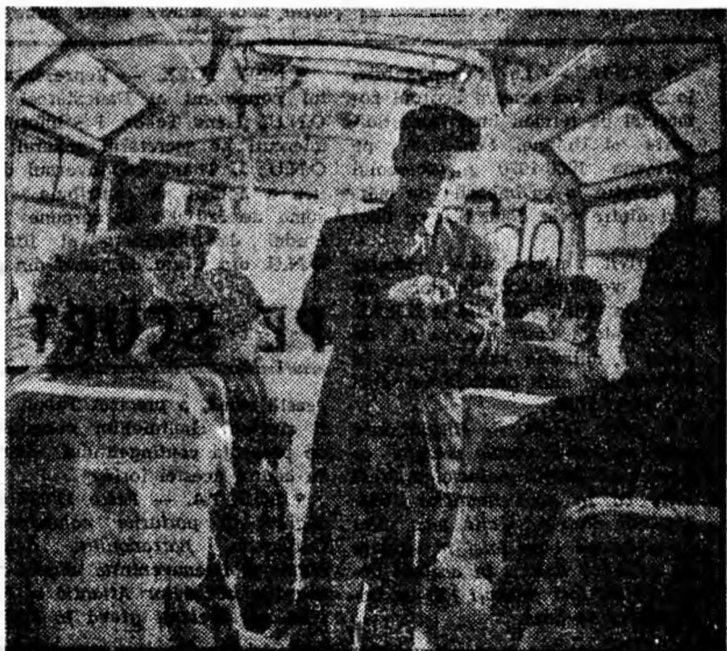
În autobuzul de Uricani.

PETROȘANI — 7 NOIEMBRIE: Căpitanul din Tenkes, seria I și II; REPUBLICA: Viață dificilă; PETRIȚA: Ah! Eva; LONEA: Sărutul; VULCAN: O stea cade din cer; CRIVIDIA: Judecătorul de minori; PAROȘENI: Ziua ferticității; LUPENI — CULTURAL: Intîlnire la Ischia.