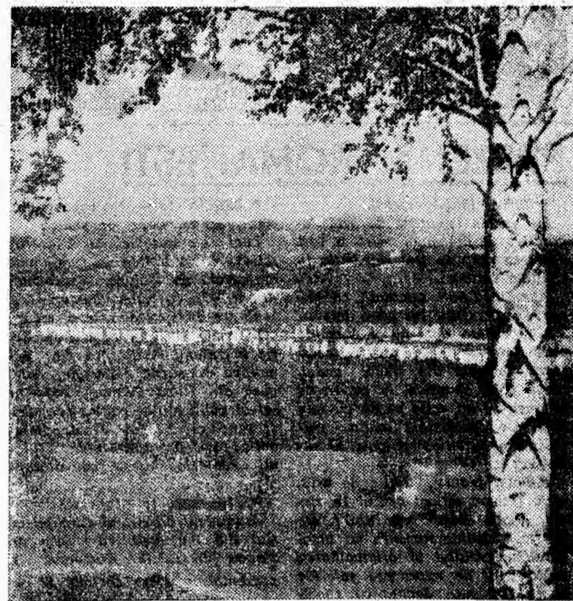
Panorama noului cartier Livezeni.

În încheiere, tovarășul Lazăr a arătat că la mina Lupeni există toate condițiile în vederea obținerii unor rezultate mai bune. În cadrul minei activează o organizație de partid puternică, care capabile să asigure înfăptuirea măsurilor preconizate în vederea redresării activității minei. Vorbitorul a exprimat convingerea Biroului Comitetului orașenesc de partid Petrosani că, în frunte cu comunistii, colectivul exploatarei va munci cu perseverență, va valorifica toate posibilitățile spre a repurta noi succese în sporirea producției, îmbunătățirea activității de investiții și respectarea N.T.S., în înfăptuirea marilor sarcini puse de Congresul al IX-lea al Partidului Comunist Român.