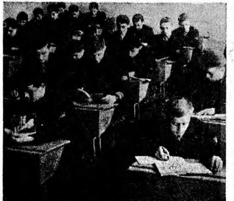
În timpul unei ore de curs Aplecați deasupra caulelor de nărav, elevii înscriu în ele explicațiile profesorului.

Orice comentarii sînt de prisos. Dar se ridică o întrebare: pe cînd stăpînea acestui nărav de către cel în drept s-o iacă? Conducerea O.L.F. Petroșani are datoria să pună capăt preferențierilor în deservirea cumpărătorilor în unitatea cu pricina, practică ce nu-și are loc în comerțul nostru socialist.