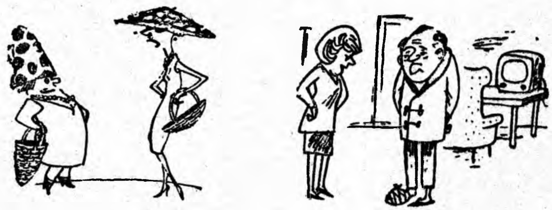
Cluperci de toamnă.