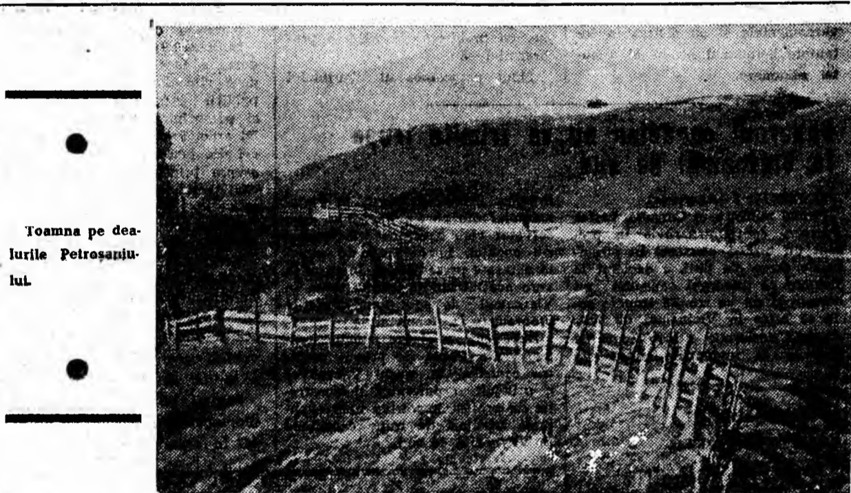
Toamna pe dealurile Petroșaniului.

• Conducerea exploatării să oblige sectorul de transport de a respecta dispoziția în ceea ce privește scoaterea de la investiții, în fiecare schimb, a 50—60 vagonete cu steril.