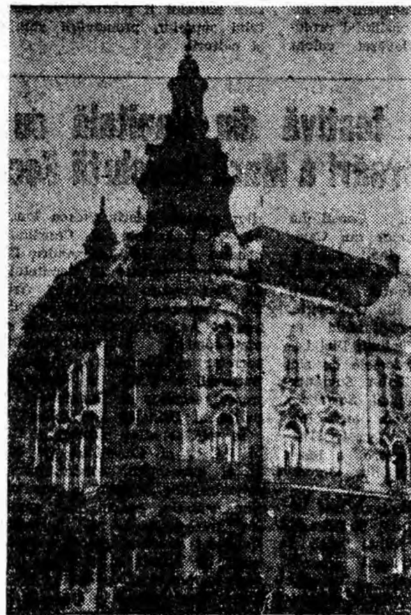
Hotelul „Continental” din Cluj.

Totodată, Clujul este și un important centru cultural, industrial și comercial. Aici se află numeroase cinematografe, trei teatre și două opere, o orchestră simfonică, mai multe muzee, bibliotecă și instituții de învățămînt superior, Universitatea „Babeș-Bolyai”, precum și numeroase fabrici, uzine, întreprinderi și instituții.