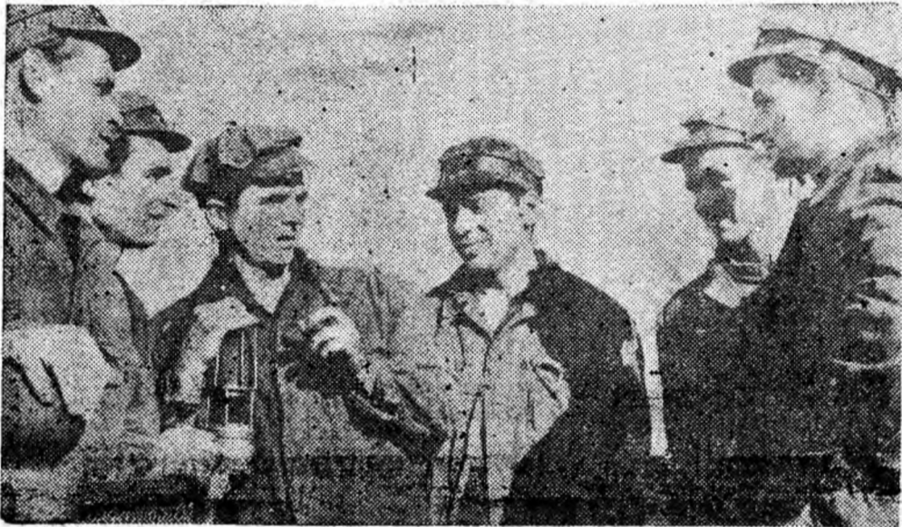
MINA PETRI-LA. Brigada condusă de Apostol Ioan de la sectorul III a încheiat luna octombrie cu o depășire de 800 tone cărbune.