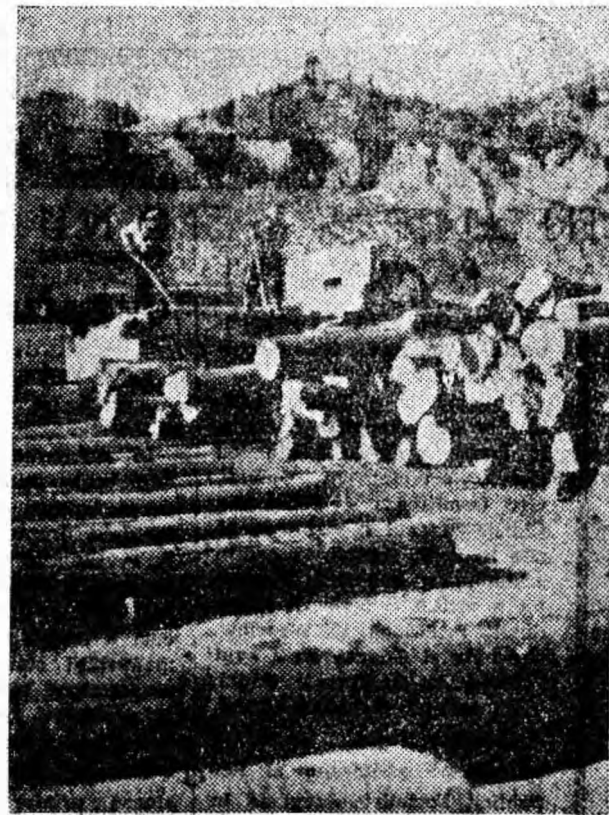
În drumul lor de la Polatiște înspre combinatele de prelucrare, buștenii fac un prim popas în stația Livezeni. De aici, vor continua drumul cu trenul.