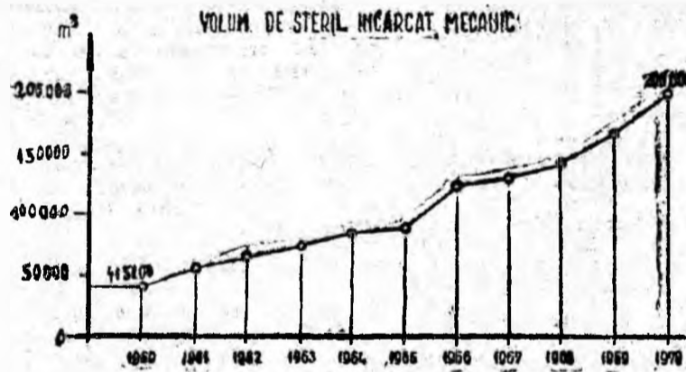
Fig. nr. 2

În domeniul mecanizării principalelor operațiuni trebuie și se pot lua măsuri de modernizare a utilajului de transport de abataje și preabataje, de introducere a mașinilor de încărcat la înaintările în cărbune, de extindere a mașinilor de încărcat la înaintările în steril și puțuri. În graficul din Fig. nr. 2 se redă creșterea realizată la volumul de steril încărcat mecanic în