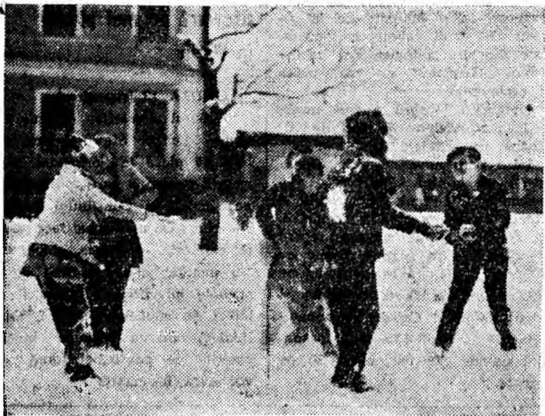
Prima bătăle cu zăpadă.