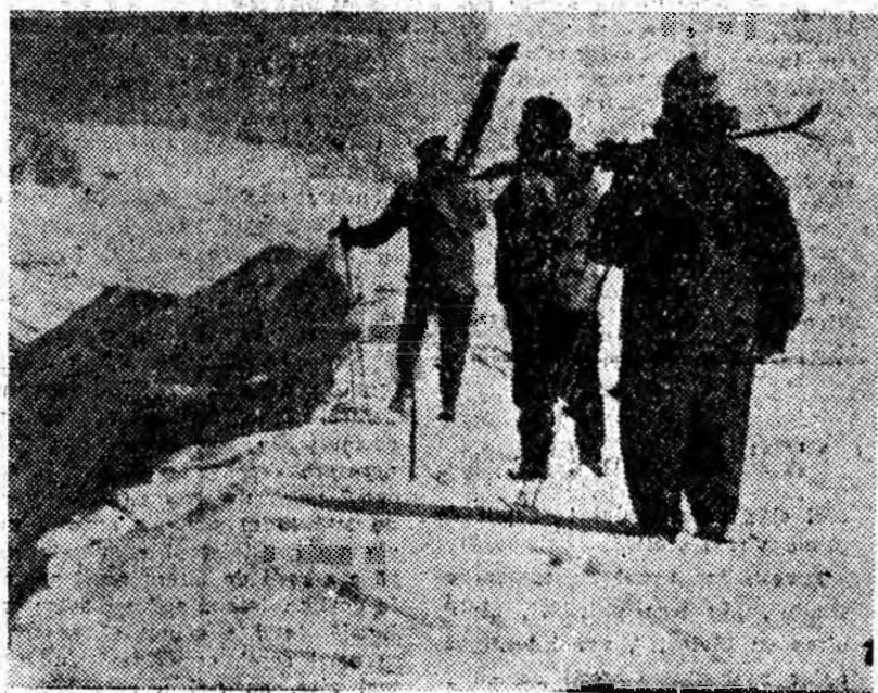
Invitație la schi.