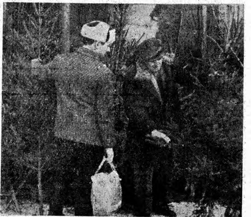
Prin unitățile O.L.F. au fost puși în vânzare brazi pentru pomul de iarnă.