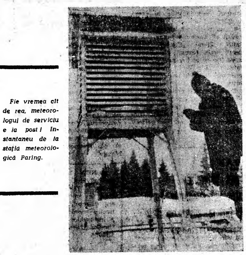
Fie vremea cît de rea, meteorologul de serviciu e la post! Instantaneu de la stația meteorologică Paring.