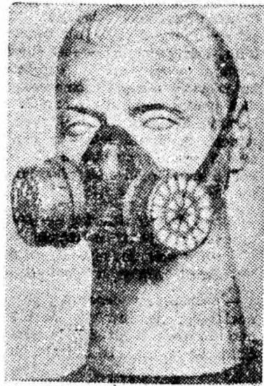
Mașca Pirelli. Un lot de măști de acest tip a sosit de curînd în Valea Jiului urmînd să intre în dotarea exploatareilor miniere.

Rezultatele privind eficiența de reducere a prafului din atmosfera frontului de lucru au arătat că o eficiență ridicată o asigură perforajul umed lateral, perforajul umed axial și dispozitivul Holman, la perforare; stropirea cu apă, la încărcarea manuală și mecanică; burajul cu apă și perdeaua de ceață — la pușcare. S-a experimentat, la E. M. Petrila burarea găurilor cu fiole din material plastic, cu autoînchidere. În urma experimentării a 2 500 bucăți rezultă că procedeul de pușcare cu buraj cu apă poate