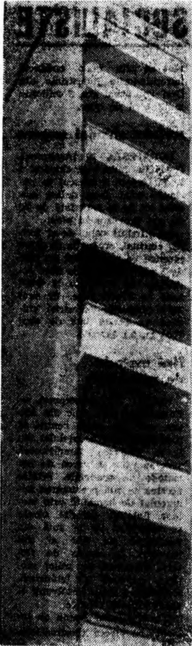
GEOMETRIE COTIDIANĂ (Bloc din Vulcan)