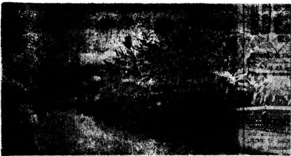
Iarna prin aer.