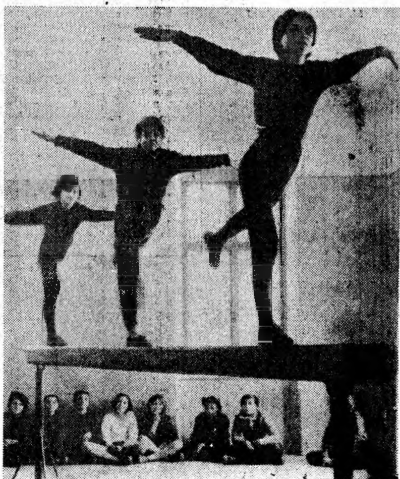
Gimnastica — o ramură sportivă mult îndrăgită în școală. Clîșeul înfățișează un exercițiu la birnă. Execută elevii de la Școala generală nr. 4 Petroșani.