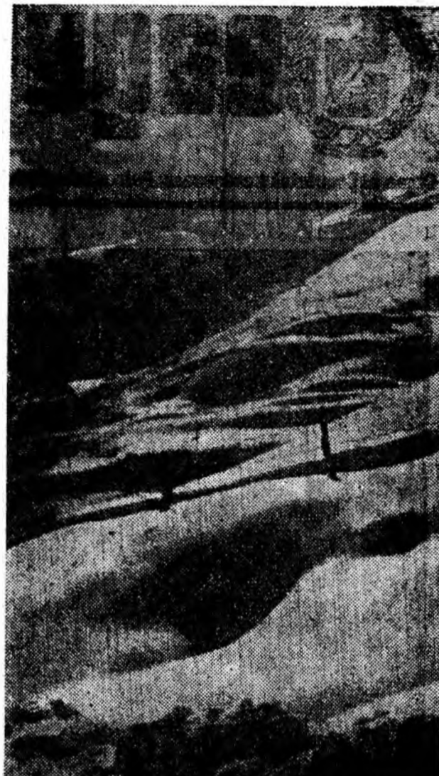
Decor de iarnă pe Valea Jiețului.

Demne de vizitat prin părțile acestea sînt mănăstirea Văratec, unde se află mormîntul Veronicăi Micie, precum și mănăstirea Agapia, ale cărei picturi — realizate de Nicolae Grigorescu — te impresionează în mod cu totul deosebit.