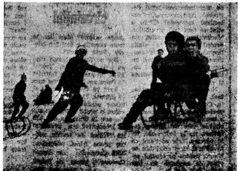
Pe dealușul din Lunca.