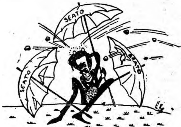
GENERALUL KY: Simt că victoria e pe aproape... (Desen din „Kambuja” — Pnom Penh)

WASHINGTON (Agerpres). — Hotărîrea președintelui Johnson de reluare a bombardamentelor asupra R. D. Vietnam a provocat, după cum relatează agenția France Presse, „o profundă neliniște atît în cadrul opiniei parlamentare cît și a opiniei publice americane”