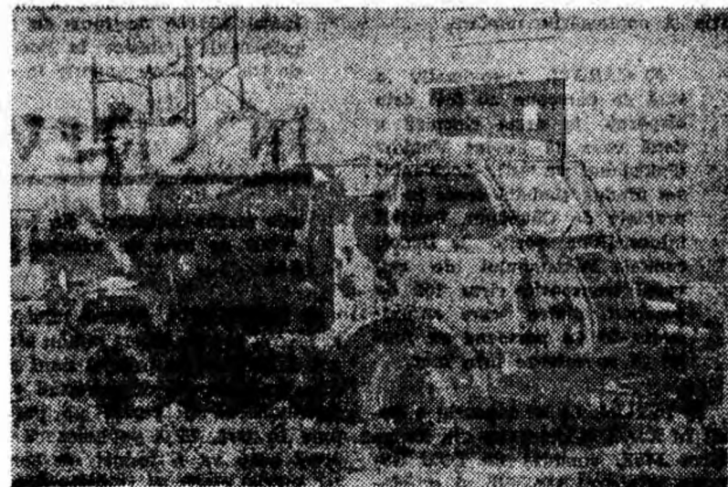
A-ncremenți ca-ntr-un tablou de Luchian De-atîta timp avînd aceeași soartă Incît exclami, trecînd pe lîngă el, cu aleaz: Cum de s-a transformat așa-n natură moartă?

De mult timp șade nefolosit (sau negăsat) în curtea I.P.I.P. Livezeni, automalaxorul din fotografia noastră.