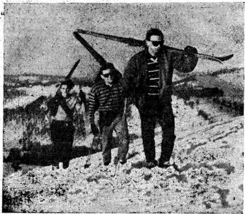
Spre pirtia de schi.

◆ Miine sosesc la Lupeni echipele reprezentative ale schiorilor din asociațiile sportive ale raioanelor regiunii Hunedoara, care vor participa sîmbătă și duminică, pe pirtiiile de schi din jurul cabanei „Straja”, la întreceri pentru cîștigarea „Cupei 16 februarie” și la etapa regională a campionatului republican de schi pentru seniori și senioare.