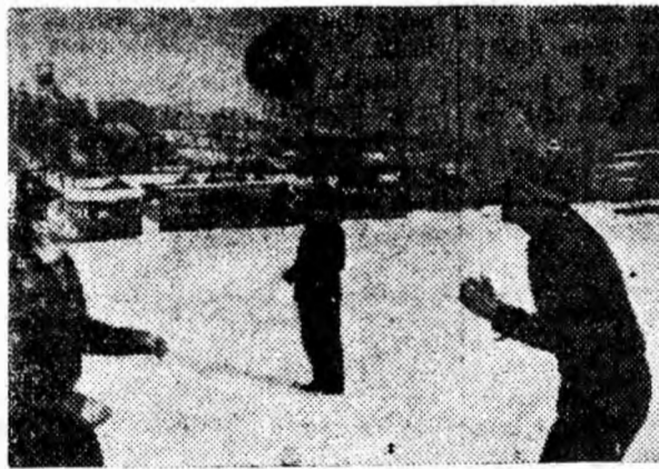
Juniorii de la Minerul și-au început și ei antrenamentele. Iată o fază de la o ședință de antrenament.