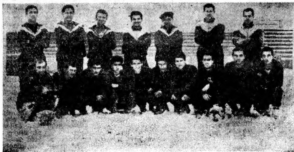
Lotul echipei de fotbal Minerul Lupeni, după unul din antrenamente.