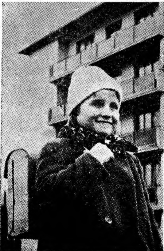
În drum spre școală.