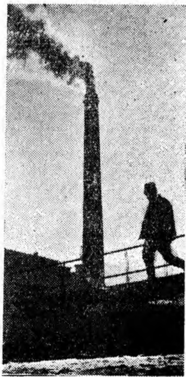
Incepe o nouă zi de muncă.