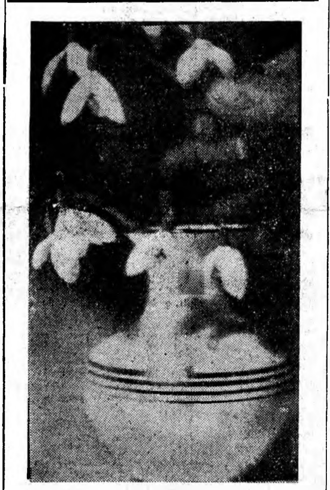
Au înflorit ghiociei.