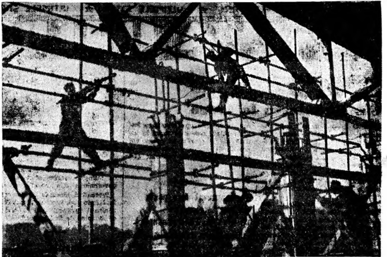
Pe șantierul autobazei de la Livezeni.

Schimbul de experiență organizat de Comitetul orașenesc de partid s-a dovedit de o deosebită utilitate. Propagandistii au avut cu acest prilej posibilitatea să cunoască metode eficiente ale acestei munci de mare răspundere, dar deosebit de frumoase. Aplicînd în activitatea lor cele învățate cu acest prilej, nu încapă îndoială că propagandistii din Valea Jiului vor contribui la ridicarea calitativă a învățămîntului de partid, la însușirea temeinică de fiecare cursant a istoricelor documente ale celui de-al IX-lea Congres al partidului nostru.