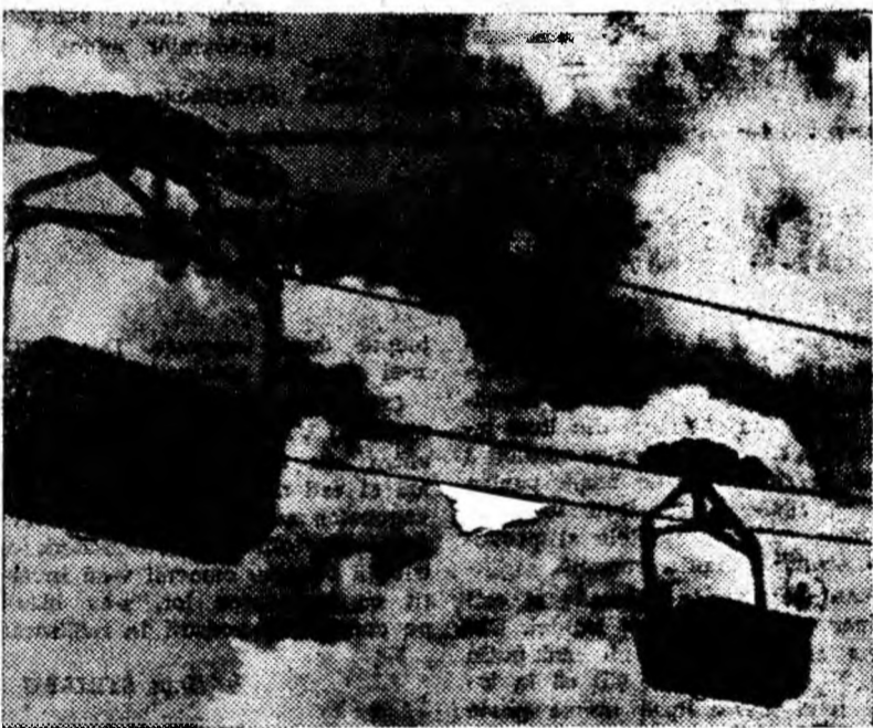
Întîlnire pe drumul aerian al cărbunelui.