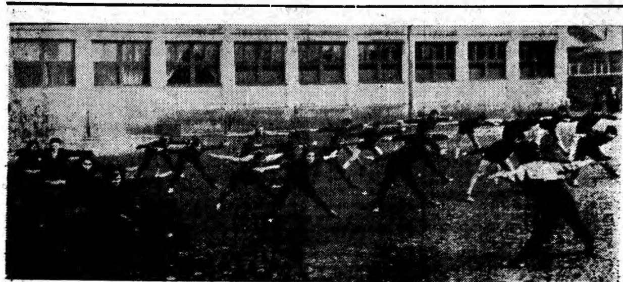
Oră de educație fizică la clasa a X-a de la Liceul din Petrila.