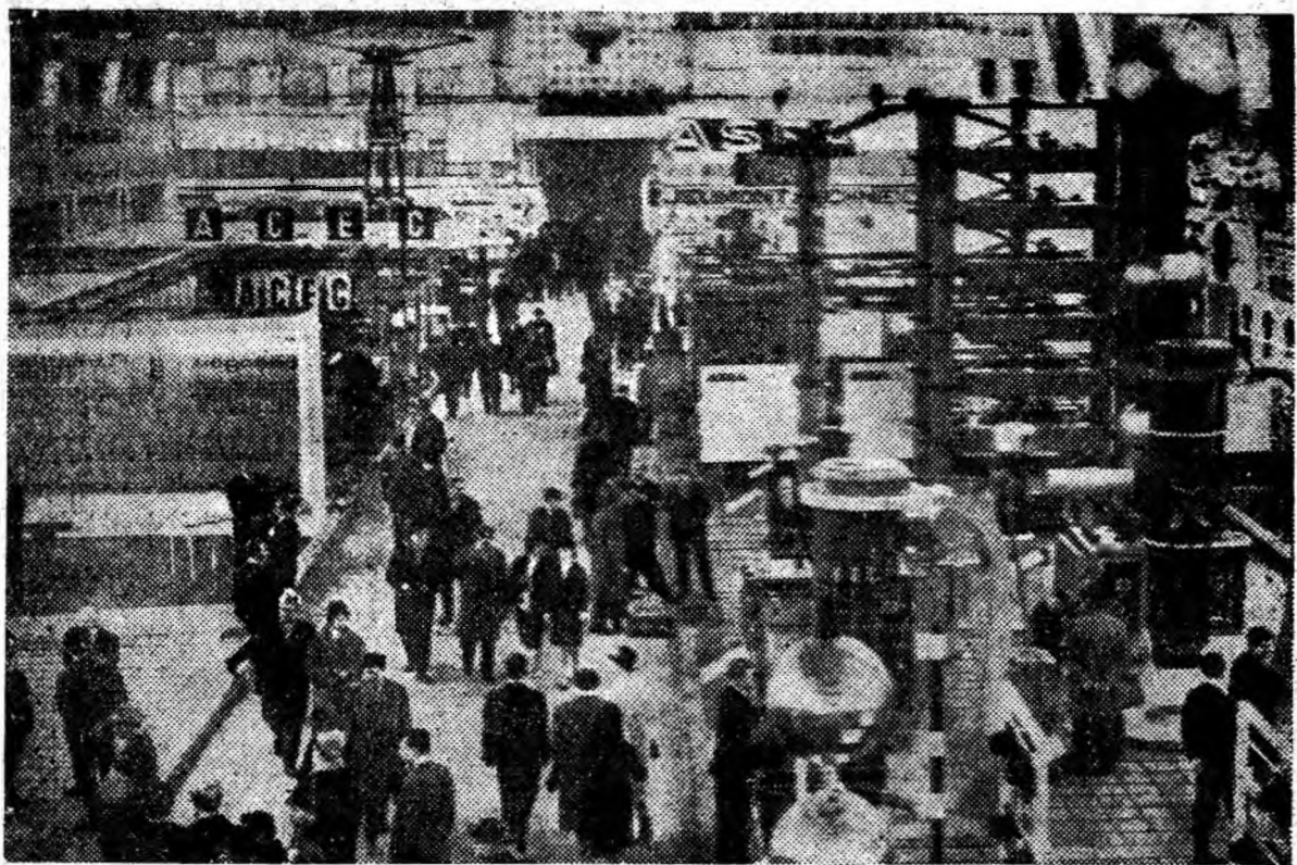
Aspect din cadrul sectorului tehnic al târgului — hala de produse ale industriei electrotehnice.

● SANTIAGO DE CHILE. Duminică s-au desfășurat alegeri parțiale în provincia Valparaiso din Chile, pentru completarea unui loc în Camera deputaților a Congresului național rămas vacant anul trecut prin încetarea din viață a unui reprezentant al Partidului radical. Agenția Associated Press relatează că reprezentantul Partidului democrat-creștin (de guvernămînt), fostul primar al orașului Valparaiso, Juan Montedonico, a cîștigat alegerile. El a obținut însă un număr mai mic de voturi decît 51,4 la sută înfrunite de Partidul democrat-creștin la alegerile generale din anul trecut.