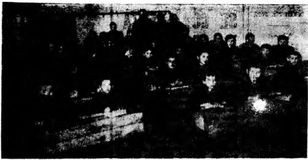
La 9 oră de curs înaintea încheierii trimestrului.

Foarte scurt, în comparație cu primul trimestru al II-lea s-a scurs pe nesimțite. Situația la mijlocul anului școlar, el poate fi considerat cel mai important, întrucât ajută cadrele didactice și elevii să-și concentreze atenția și eforturile spre acele probleme care nu și-au găsit o rezolvare mulțumitoare.