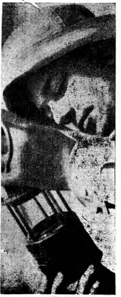
Fotografat în mină.