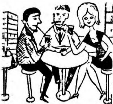
Deși sînteți în floarea vieții Stați ore-n șir lângă pahar, În loc de stîlpi ai tineretii Fumți în stîlpi de... Café-Bar.

Uni tineri din Petroșani își petrec orele libere stînd pînă noaptea țerziu la Café-Bar.