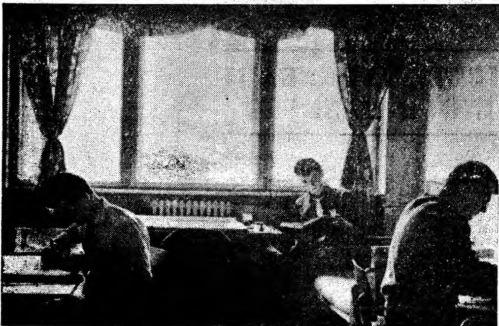
Confort și ambianță. Interior plăcut ce te îmbie la învățătură în unul din căminurile studențești din Petroșani.