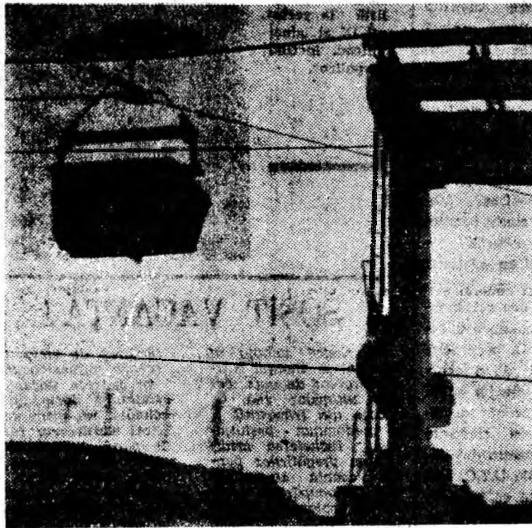
Funiculare (pe traseul Aninoasa sud — Coroști).