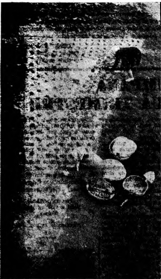
Se pregătește un nou covor de iarbă și flori.