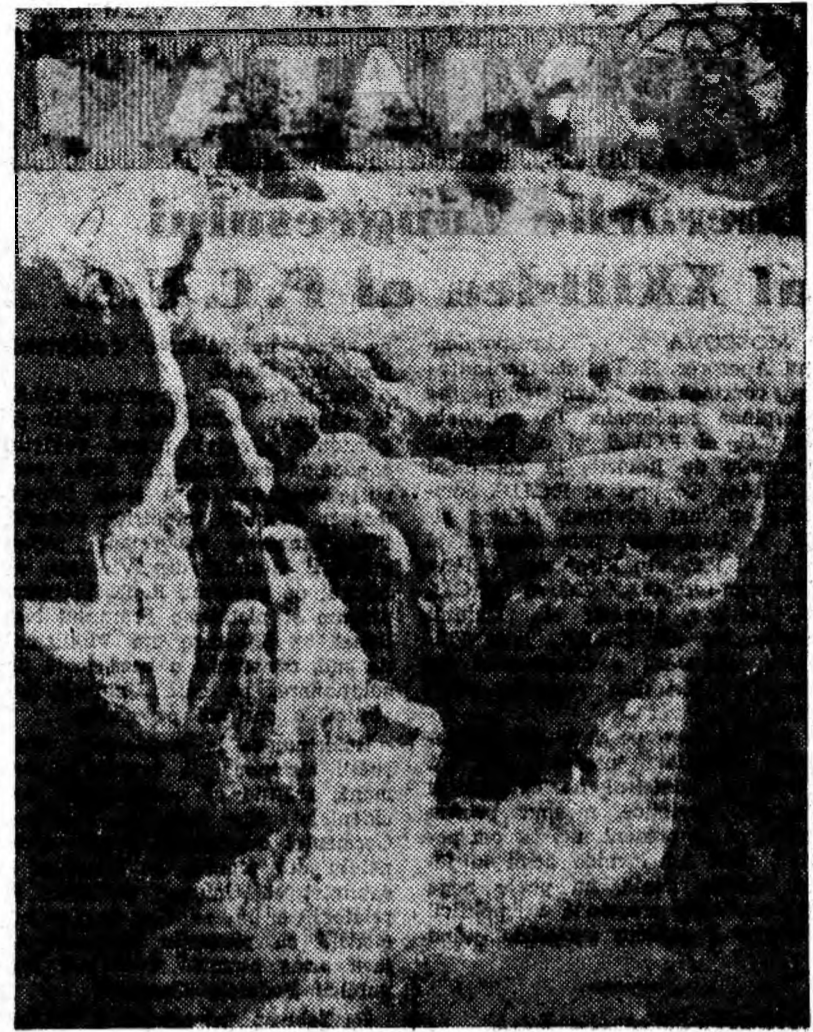
Fanteziile iernii... tîrziu. Pîrliașul de munte a îmbrăcat iarăși vestiminte de basm.

PROGRAMUL I: 5,00 BULETIN DE ȘTIRI; 5,06 Melodiile dimineții; 5,40 Uverturi interpretate de fanfară; 5,50 Jocuri populare; 6,00 Sport. Buletin meteo-rutier; 6,10 Muzică ușoară; 6,15 TRANSMITEM PENTRU SATE; 6,22 Potpuriri interpretate de orchestra Werner Müller; 6,30 Din nou muzică ușoară; 6,45 Salut voios de pionier; 7,00 RADIOJURNAL. Buletin meteo-rutier; 7,15 Uverturi de estradă; 7,30 Muzică ușoară interpretată la instrumente electronice; 7,45 „Mindre-s cîntecule noastre” — emisiune de folclor; 8,00 SUMARUL ZIARULUI „SCINTEIA”; 8,06 Program de marșuri și polci; 8,20 Cîntec de Ion Chirescu; 8,30 La microfon, melodia preferată; 9,30 Sfatul medicului; 9,35 Trio pentru coarde de Cornel Țăranu; 10,00 BULETIN DE ȘTIRI; 10,05 Rapsozi ai cîntecului nostru popular: Irina Micu, Eleonora Bisorca, Dumitru Bălășoiu, Ion Lăceanu, Costel Moisa; 10,30 DICȚIONAR LITERAR PENTRU ȘCOLARI: Reportajul; 11,00