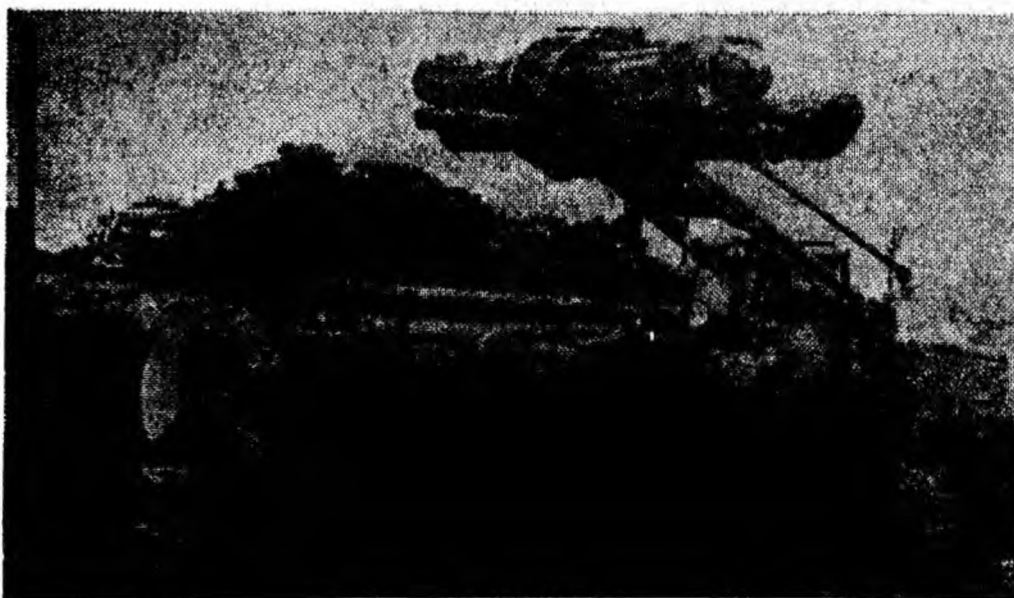
Din trei „mușcători”, puternica mașină Bolinder descarcă un camion, ducând buștenii direct în vagon.

◆ Selecționarea atentă a materialului lemnos, pentru a scoate cât mai multe sortimente valoroase din el, trebuie făcută cu o mare pricepere. Această necesitate însă înființarea unor cursuri pentru sortatori, maștrii și șefii de brigadă prin care aceștia să primească cunoștințele necesare. Și acest aspect trebuie prins în planul de școlarizare al întreprinderii.