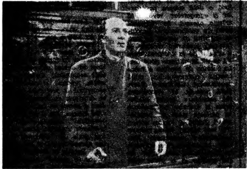
O secvență din filmul „Procesul alb”, producție a studiourilor cinematografice „București”, ce rulează de ieri la cinematograful „7 Noiembrie” din Petroșani.