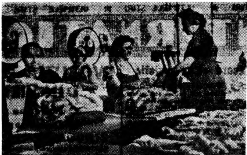
Fabrica de fibre artificiale Viscoza Lupeni. Un mînunchi de muncitori împachetează sculturile de mătase care au trecut cu bine examenul exigent al controlului de calitate.