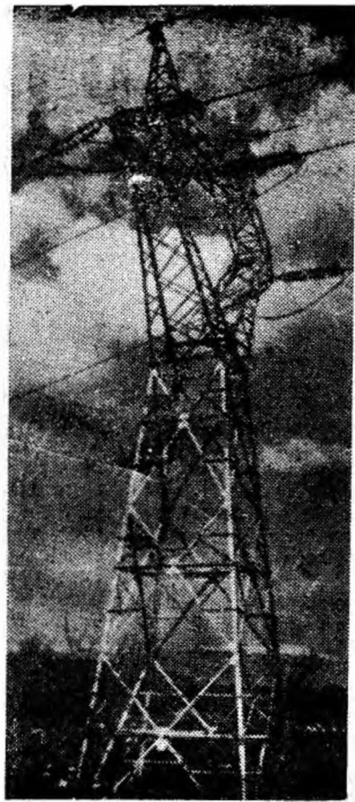
Punct de sprijin pe calea kiloașilor.