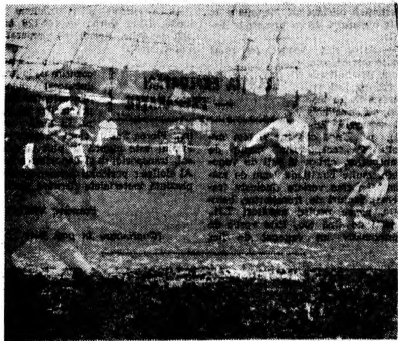
Aspect de la întâlnirea de fotbal Știința Petroșani — C.F.R. Teiuș. Atac la poarta celorștilor soldat cu un nou gol: 4-0.