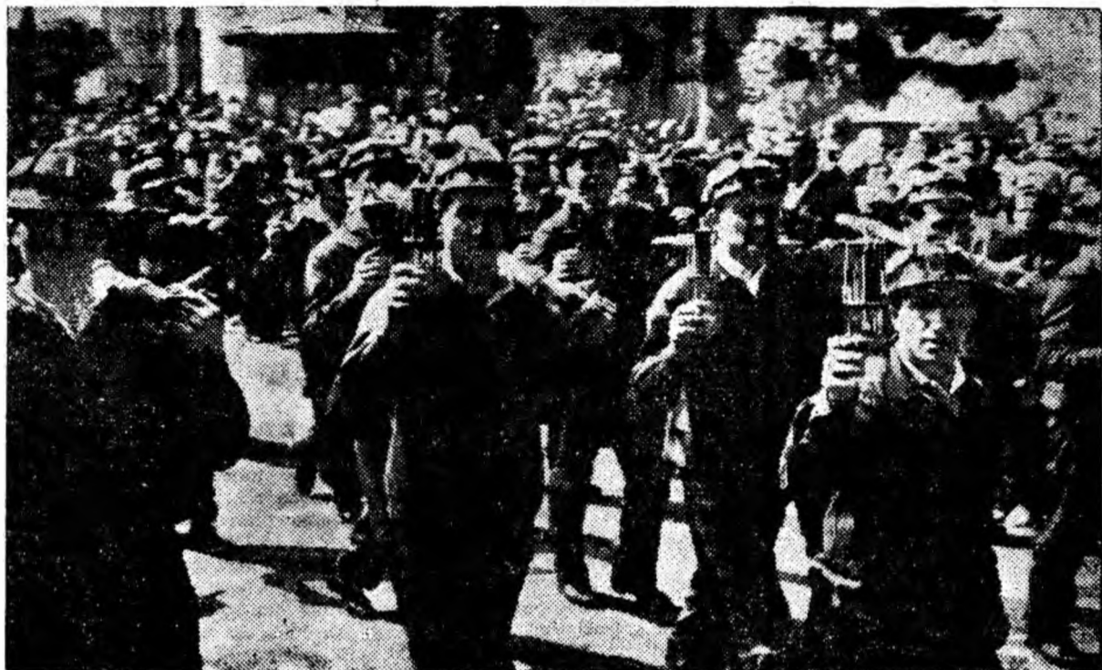
În deschiderea demonstrației oamenilor muncii, trece în rînduri compacte coloana minerilor aninșeni.

— Bucuria datoriei împlinite. Am avut ca angajament 300 tone pînă la 1 Mai. Am realizat 800 tone. În aprilie am atins o avansare record la care rîneam de mult: 190 m l pe lună. Planuri de viitor: Să a-