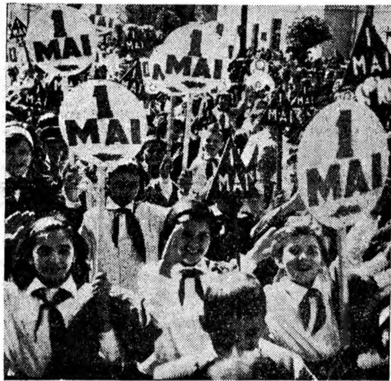
Plini de bucurie, deschid demonstrația pionierii — primăvara vieții noastre.