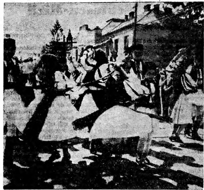
În virtutea jocului popular (formația de dansuri a cîminului cultural din Cimpă).