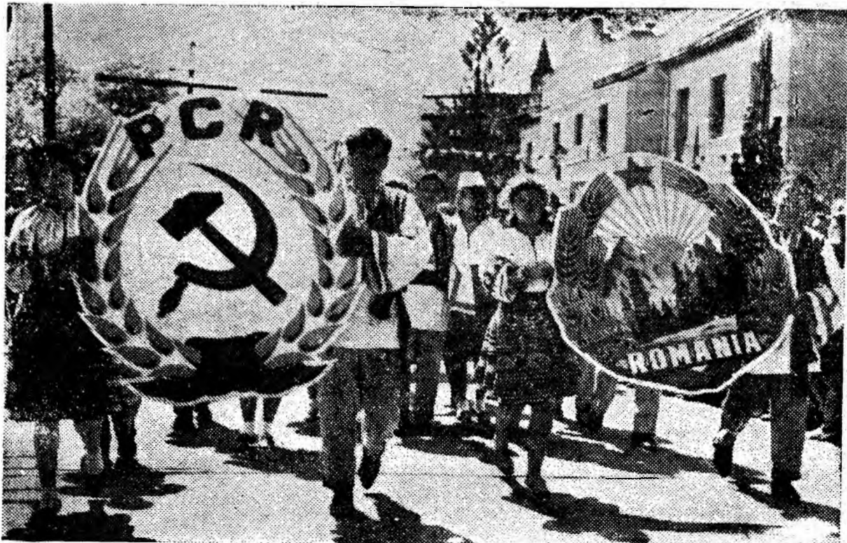
Pentru prima oară, 1 Mai s-a sărbătorit în republică socialistă! Tineri îmbrăcați în frumoase costume naționale, poartă cu mîndrie în fruntea coloanelor de demonstrație stemele Partidului Comunist Român și ale Republicii Socialiste România.