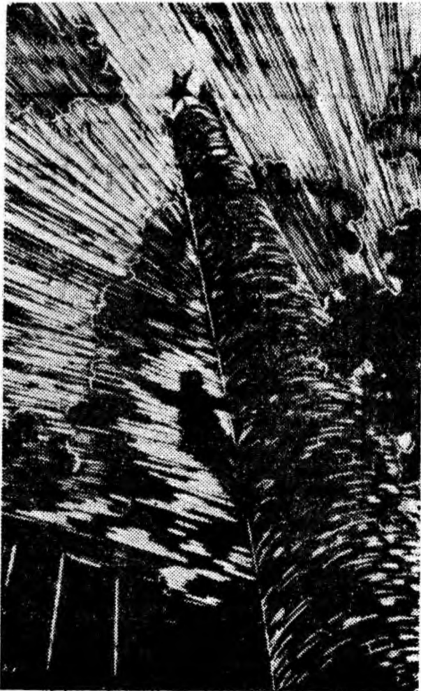
„SPRE SOARE” — linogravură de Nagy Ervin