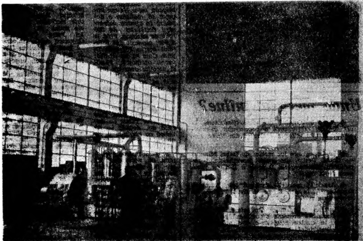
Stația de compresoare de la mina Paroșeni e gata de recepție.