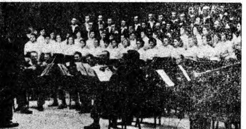
La rampa scenei, corul și orchestra clubului muncitoresc din Petrița.