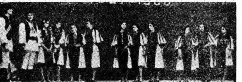
„Nuntă la Cîmpa” — dans tematic — prezintă echipa de dansuri a Căminului cultural din Cîmpa.