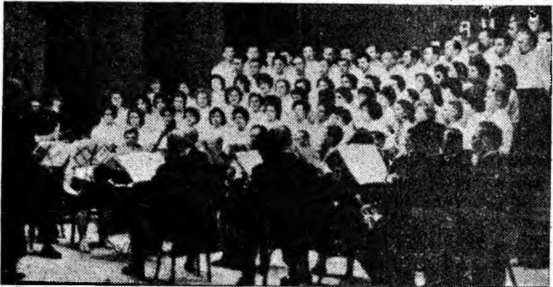
Evoluează corul și orchestra clubului sindicatelor din Petroșani.