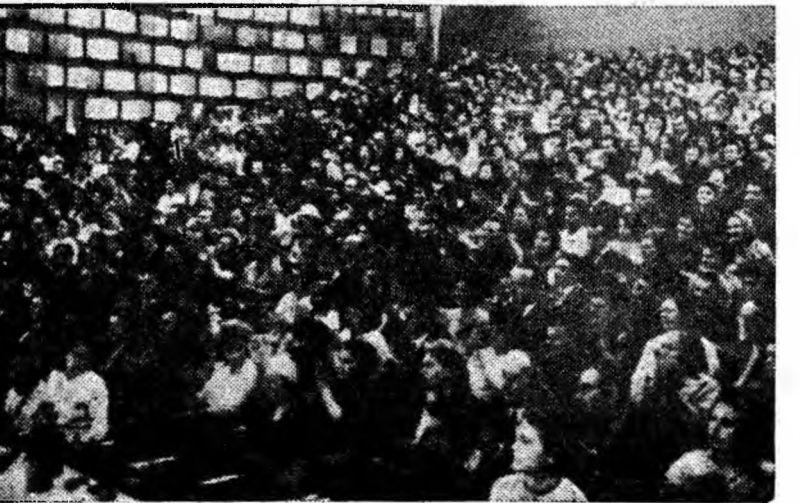
Aspect din sală în timpul spectacolului.