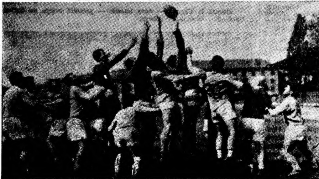
Rugbiștii de la Știința în luptă pentru balon.