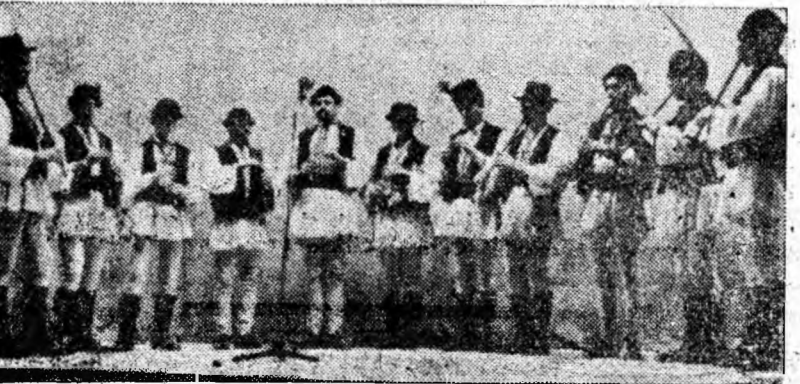
Își prezintă programul fluierașii de la Cîmpa.