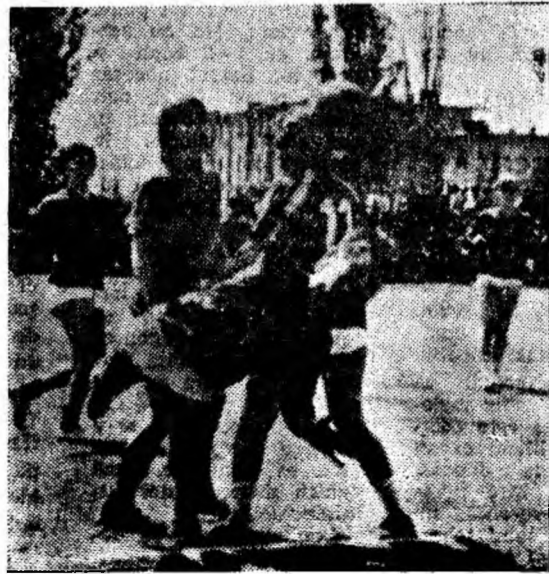
Un nou atac al S.S.E., dar mingea va trece pe lângă poartă.