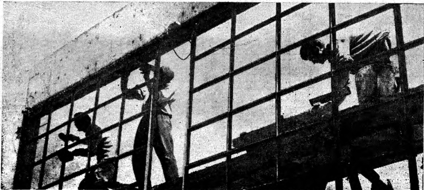
Zidari pe schelele construcțiilor industriale de la mina Paroșeni.