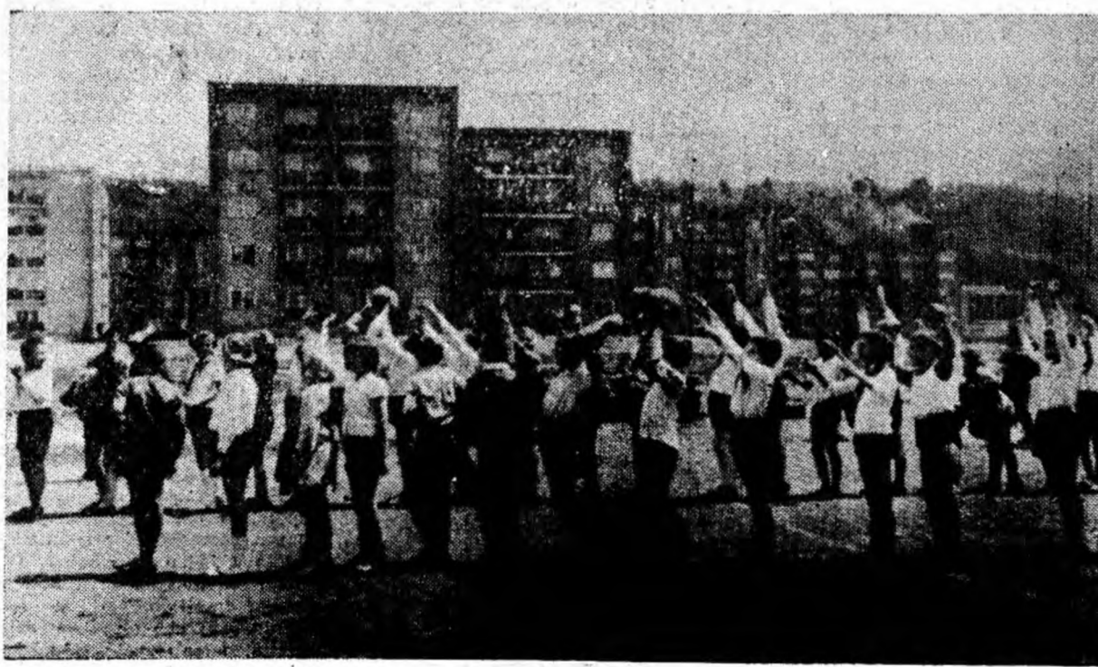
Tinerețea carierului Livezeni — Petroșani.

De exemplu, exigența și principialitatea. Reproșăm unui tînăr tendința de a-și lua examenul pe căi ocolite, prin relații personale. Tînărul observase că au existat împrejurări cînd unii au reușit să treacă examenul prin astfel de metode și, din comoditate, s-a gîndit să facă la fel. Nu-l scuz și bineînțeles nici atunci nu l-am scuzat; caracteristica esențială a tînărului este și trebuie să fie munca dirză, ambiția de a fi printre cei mai buni, de a fi folositor societății noastre socialiste. Dar nu m-am putut opri să fac următoarea reflecție: dacă acest tînăr nu ar fi observat nici un caz