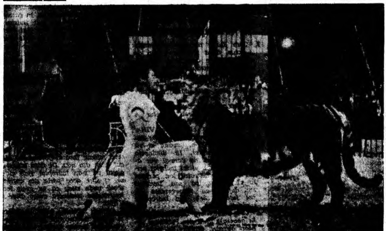
Un moment de tensiune: Margarita Nazarova îi servește masa unuia din tigri.