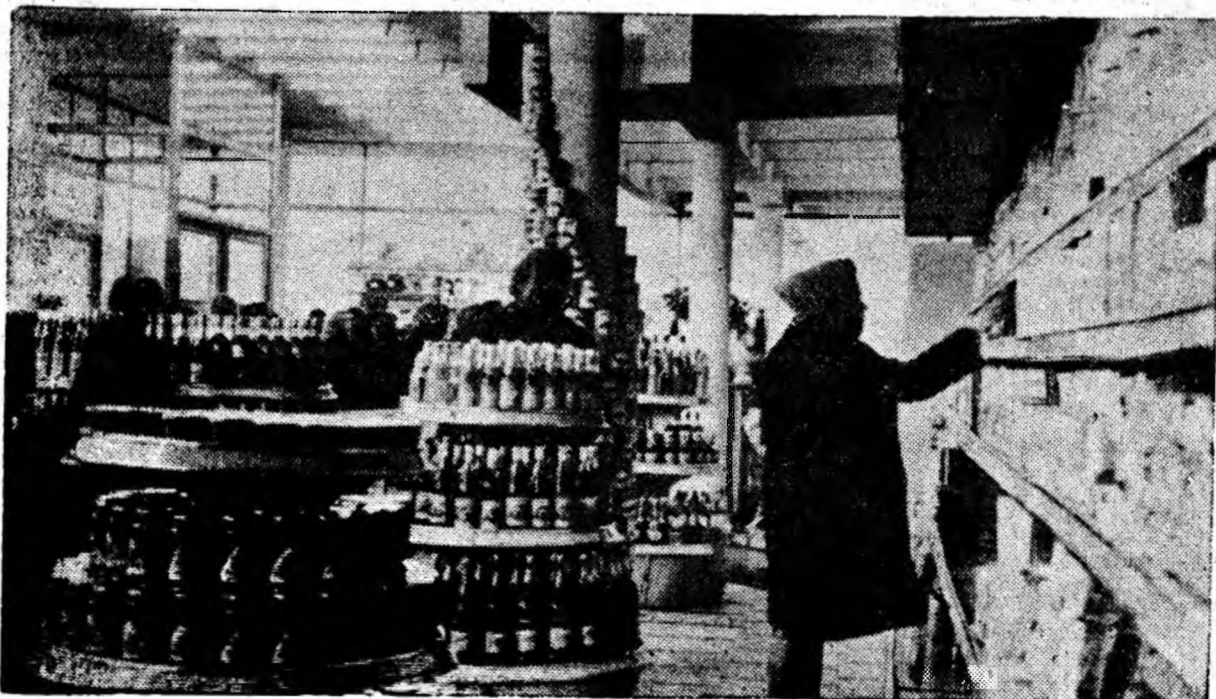
Magaziul cu ambalare din cartierul Brala — Lupeni, modern și bine aprovizionat, satisface exigențele cumpărătorilor.