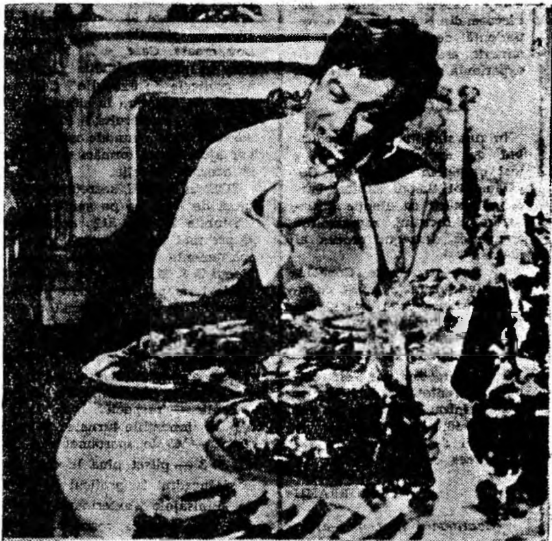
O secvență din filmul „După mine, canall!”

seze. Instrumentiștii sînt absolvenți ai școlii medii de muzică din Budapesta și se îndreaptă spre cazarma din Veszprém unde vor presta serviciul militar. La sfatul lui Ditroi, cel mai șmecher și mai „informal” dintre toți, băieții au decis să-și ia cu ei instrumentele, în speranța că vor fi repartizați în orchestra regimentului și-și vor petrece anii de militarie cîntînd, fără instrucție și fără corvezile iminente vieții ostășești. Deziluzia va fi însă totală. De aici o serie de neînțelegeri și bucluturi pline de haz.