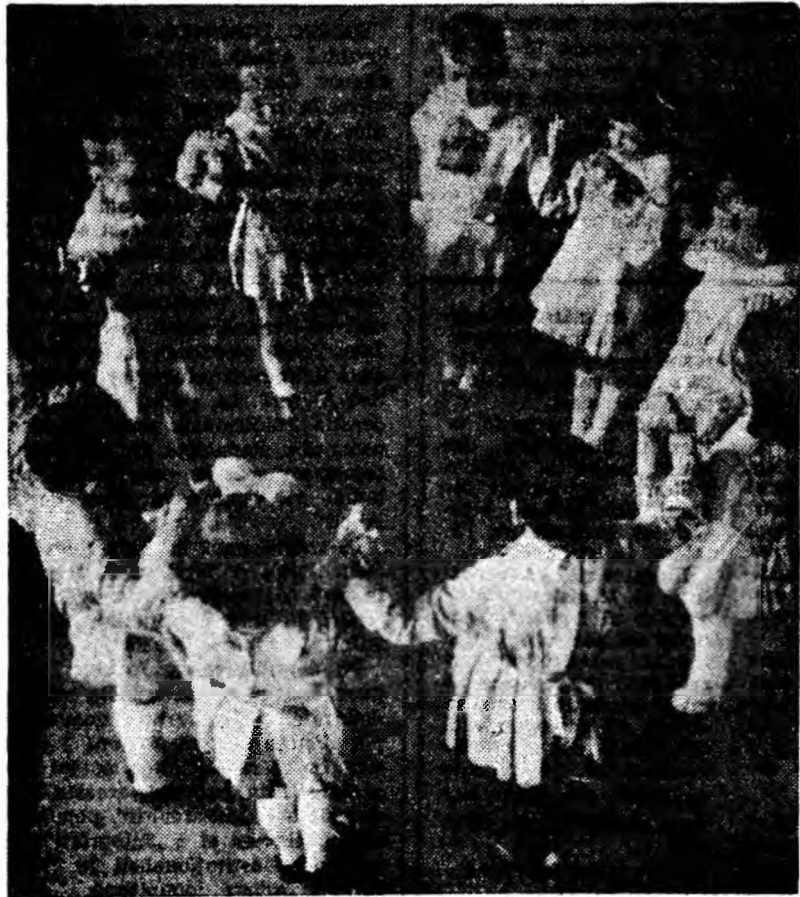
Hai să-ntindem hora mare...

PETROȘANI — 7 Noiembrie: După mine, canalii; Republica: Finala buclucășă; PETRILA: Legende din tren; LONEA — Minorul: Ani clocotitori; LIVEZENI: Libelula; CRIVIDIA: Decorații pentru copii minune; PAROȘENI: Spărgătorul; LUPENI — Cultural: Viața începe la ora 8 seara; Muncitorească: Desene secrete; URICANI: Șah la rege; BĂRBĂTENI: Cu minile pe oară.