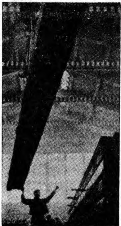
Aspect din atelierul secției de construcții metalice a U.R.U.M.P.