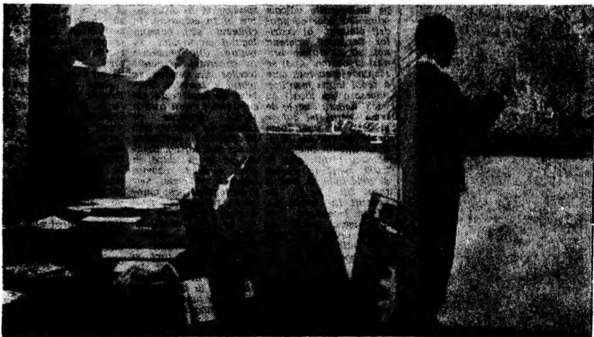
Intr-una din sălile de examene de la I.M.P.

Pagină redactată de C. COTOȘPAN și D. GHEONEA