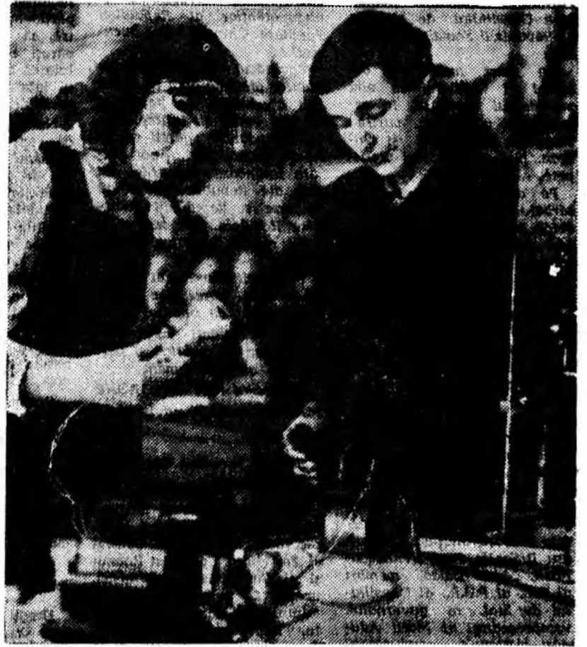
Lucrările și experiențele de laborator au fost urmărite întotdeauna cu interes de elevi, interes care nu a pierit nici în ultimele zile de școală.