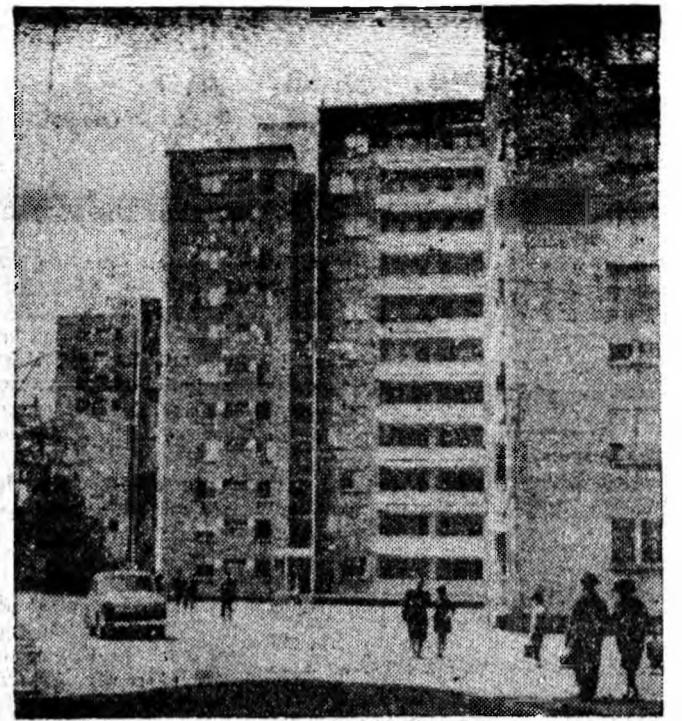
Arhitectonica prezentului innoitor se avintă pe verticala Lupeniului.

Anul XVIII XXIII Nr. 5180 Vineri 17 iunie 1966 4 pag. 25 bani